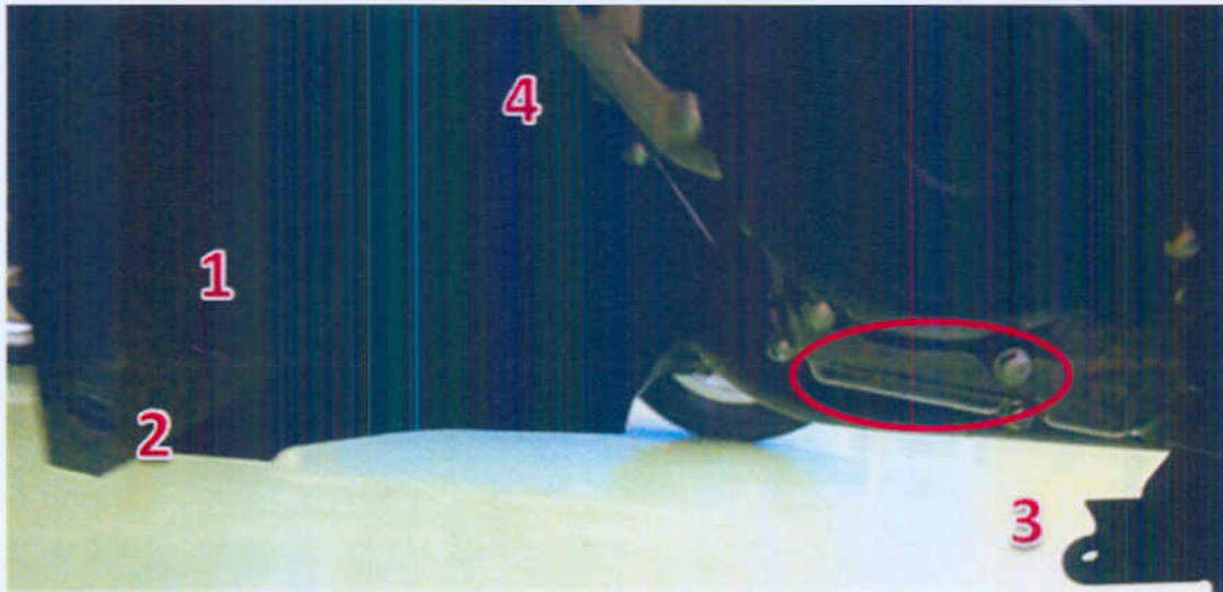
1. น็อตตัวที่ 1